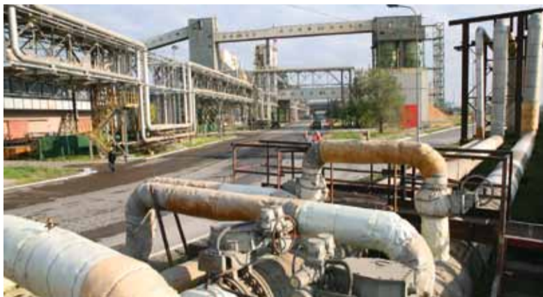
Наибольший эффект получен по экономии потребления горячей и питьевой воды, пара

Энергетики ВТЗ первый квартал 2016 года отработали без штатных ситуаций и получили значительную экономию энергоресурсов. В общей сложности около 68,5 млн рублей было сэкономлено предприятием за первые три месяца года, благодаря рациональному потреблению энергоносителей. Наибольший эффект достигнут по оптимизации расходов горячей воды, используемой для отопления, пара и питьевой воды. При этом влияние погодных условий на полученный результат по экономии можно считать лишь косвенным. Свой положительный эффект принесли принятые в конце прошлого года приказ об организации энергосбережения на предприятии и положение о материальном стимулировании подразделений за экономию энергоресурсов. Руководители цехов стали внимательнее относиться к вопросам энергопотребления, и