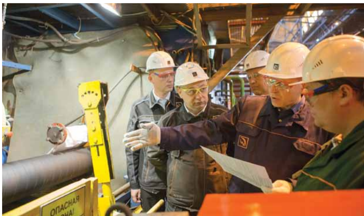
В ходе проверки большое внимание было уделено снижению рисков на производстве

ТМК ВПЕРВЫЕ ПРОВЕЛА МЕРОПРИЯТИЯ В РАМКАХ ДНЯ БЕЗОПАСНОСТИ В МЕТАЛЛУРГИИ (STEEL SAFETY DAY) ПОД ЭГИДОЙ ВСЕМИРНОЙ АССОЦИАЦИИ ПРОИЗВОДИТЕЛЕЙ СТАЛИ. АУДИТ БЕЗОПАСНОСТИ ТРУДА НА ВТЗ ПРОВЕЛ ПРЕДСЕДАТЕЛЬ СОВЕТА ДИРЕКТОРОВ ТМК ДМИТРИЙ ПУМПИАНСКИЙ