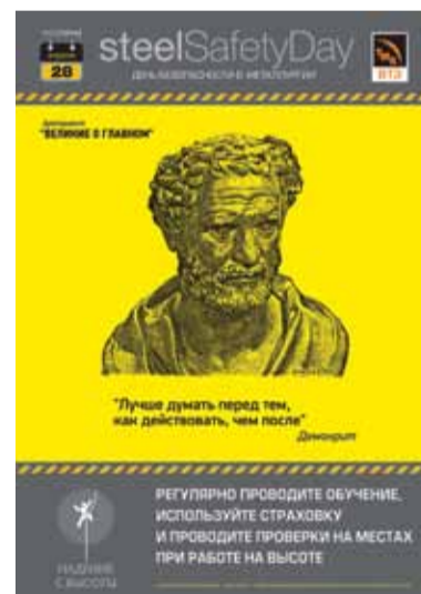
Демокрит: «Лучше думать перед тем, как действовать, чем после»

– Ключевой задачей для ТМК является обеспечение безопасности сотрудников. Мы должны брать лучшее из опыта уже на-