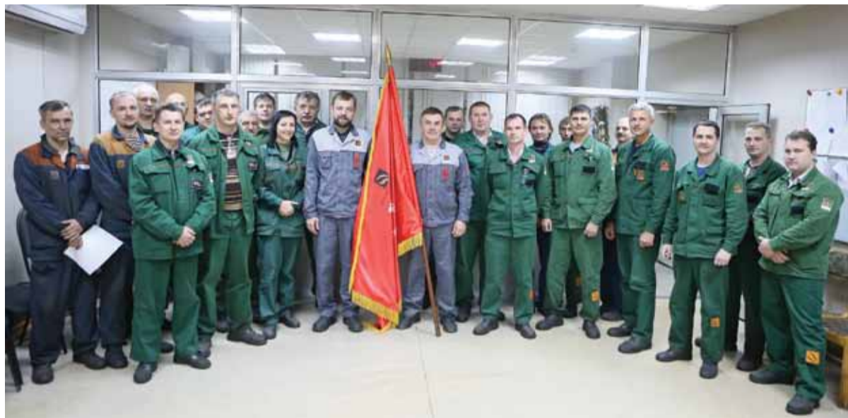
Вручение переходящего знамени «Лучший цех предприятия» добавило оптимизма и хорошего настроения всему коллективу ТПЦ-2

Коллективом ТПЦ-2 в сентябре 2016 года было изготовлено более 200 типоразмеров труб, плановые задания по сдаче и отгрузке труб перевыполнены соответственно на 6,7% и на 10%. При этом показатель сдачи про-