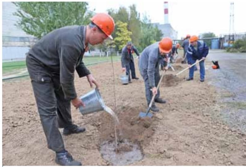
Считать возраст ТПЦ-2 теперь можно в кленах

В честь дня рождения цеха работники ТПЦ-2 посадили аллею кленов