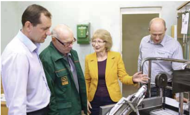
Одна из последних разработок специалистов САиСНК – прибор для измерения сцепления защитного покрытия с трубой – адгезиметр

На этой неделе заводской службе автоматки и средств неразрушающего контроля исполнилось 45 лет