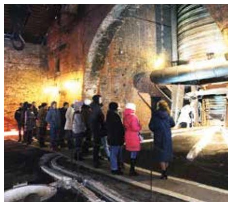
Участники впервые увидели доменную печь

Кураторы проекта от заводов и специалисты сферы образования приняли участие в работе круглого стола, на кото-