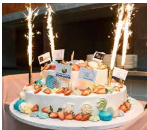
Главный сюрприз вечера

ром обменялись мнениями и поставили цели на учебный год.