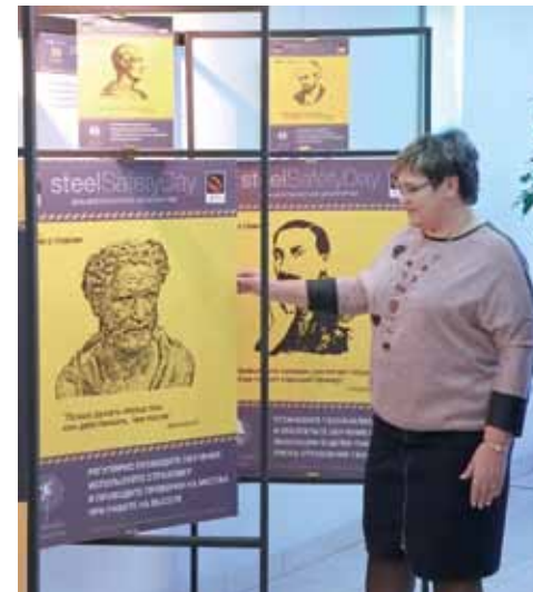
Мобильные конструкции заинтересовали посетителей

Помимо указанных проектов, Александр Хлебников является автором логотипа Года экологии ТМК, дизайнерско-