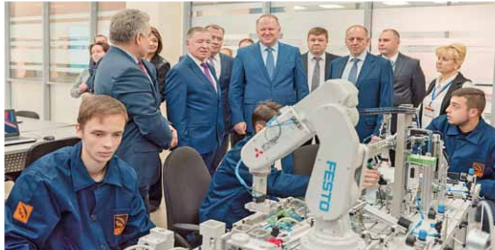
Николай Цуканов посетил Центр профессионального образования СТЗ

В рамках поездки в Полевской городской округ Николай Цуканов оценил и масштабы социальной политики градообразующего предприятия. Он посетил микрорайон Зеленый Бор, который строится с использованием инструментов государственно-частного партнерства, а также заводской физкультурно-спортив-