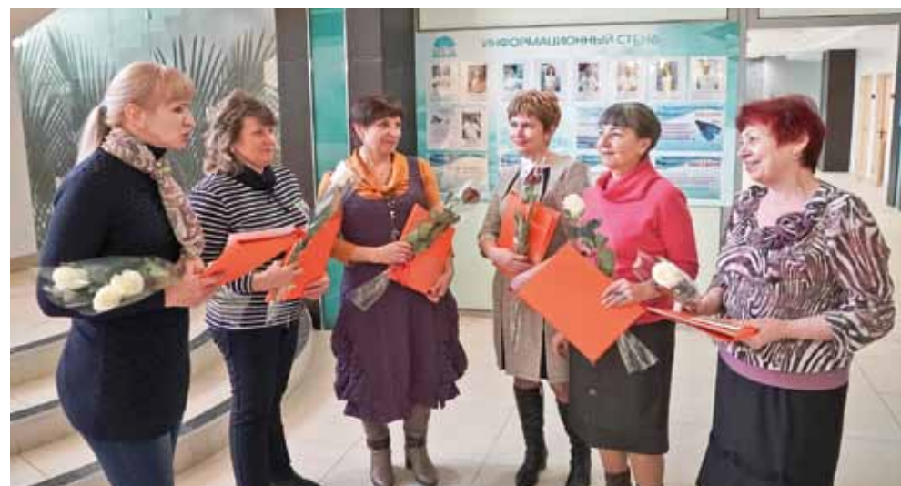
Главными героями праздника стали медработники, проработавшие в поликлинике не один десяток лет